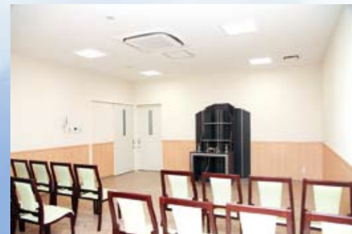
法要室 少人数での法要のご利用も可能です