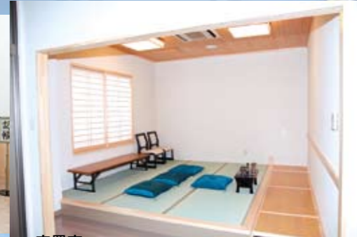
安置室 ご自宅にご安置できない場合、当会館安置室にてご遺体をお預かりいたします。