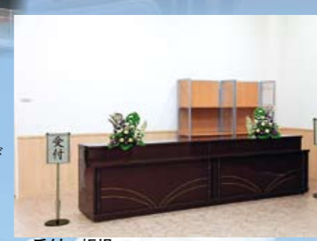
受付・帳場 広々としたエントランスとロビーに受付及び帳場をスペースとしています。

小ホール (通夜・葬儀式場) 家族葬もサポートさせていただきます。ご家族・ご親族・ご友人だけで故人を偲びゆっくりとお見送りできます。