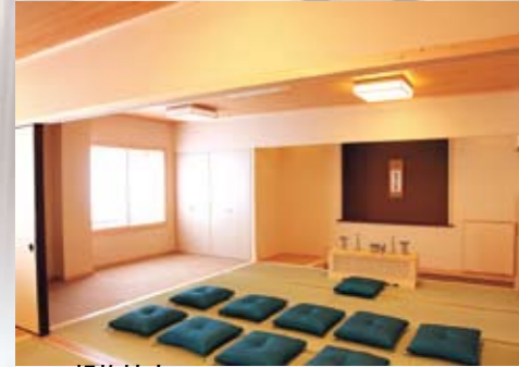
親族控室 お通夜のときにお線香を絶やさず、故人を偲ぶお集まりに、おもてなしできる和室。

大ホール (通夜・葬儀式場) 地域の皆様のため、お通夜から葬儀までトータルにご利用いただけます。全ての宗旨・宗派のご葬儀をご予算・ご希望に応じて承ります。