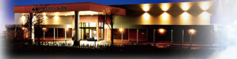
エントランス お迎え提灯が夜景にくっきり。参列者をお迎えいたします。