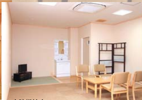
寺院様控室 ホールに足を運んでいただくご寺院様の控室です。お通夜、ご葬儀の前にお支度、着替をされるゆったりとしたスペースにてあります。