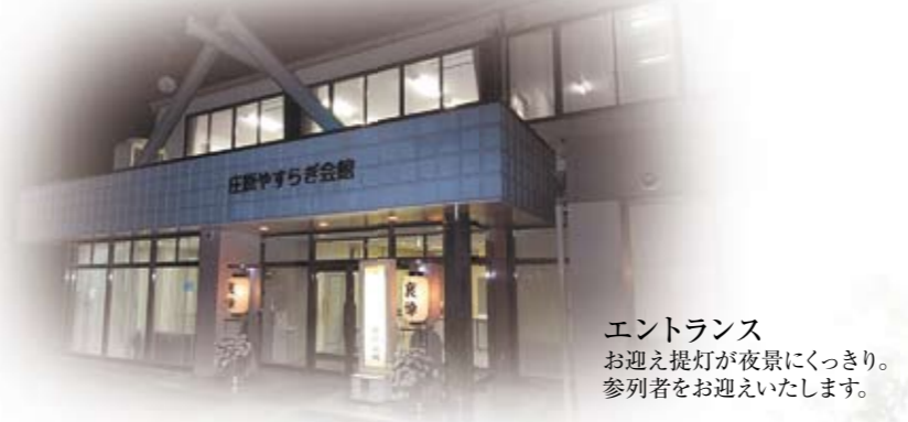
エントランス お迎え提灯が夜景にুকつきり。参列者をお迎えいたします。