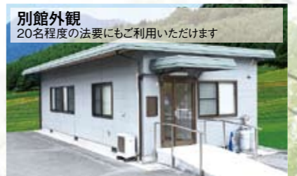
別館外観 20名程度の法要にもご利用いただけます