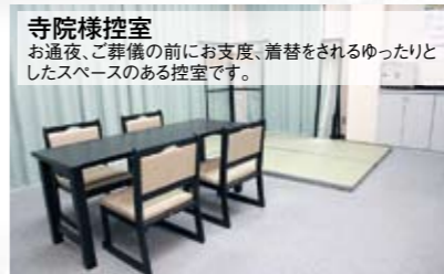
寺院様控室 お通夜、ご葬儀の前にお支度、着替をされるゆったりとしたスペースのある控室です。