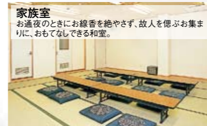
家族室 お通夜のときにお線香を絶やさず、故人を偲ぶお集まりに、おもてなしできる和室。