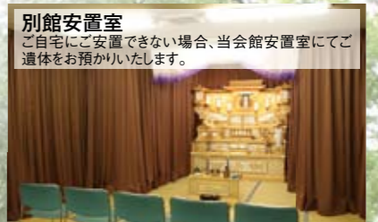
別館安置室 ご自宅にご安置できない場合、当会館安置室にてご遺体をお預かりいたします。