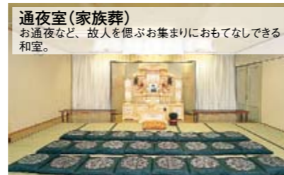
通夜室(家族葬) お通夜など、故人を偲ぶお集まりにおもてなしできる和室。