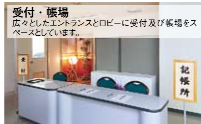
受付・帳場 広々としたエントランスとロビーに受付及び帳場をスペースとしています。