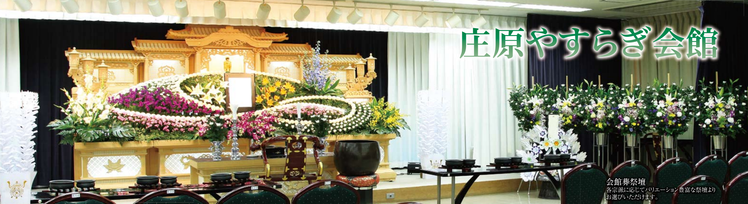
会館葬祭壇 各宗派に応じてバリエーション豊富な祭壇よりお選びいただけます。